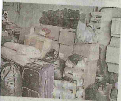
vers le Maroc pour y être distribués.

ns Ensemble pour Bessèges félicite tous ceux qui ont participé activement, soit par leur aide, soit par leurs dons, à cette collecte.